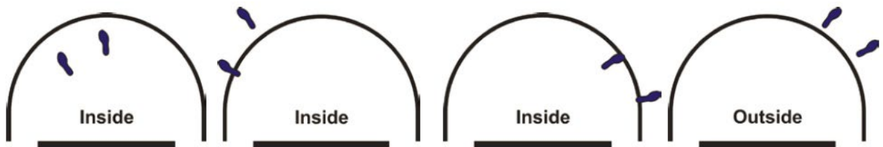
Obrázek 5 Postavení hráče uvnitř/vně území půlkruhu proti prorážení

33 - 4 Příklad: A1 začíná pokus o střelu z výskoku, který zahájí mimo území půlkruhu prorážení, a vrazí do B1, který je v kontaktu s půlkruhem proti prorážení.