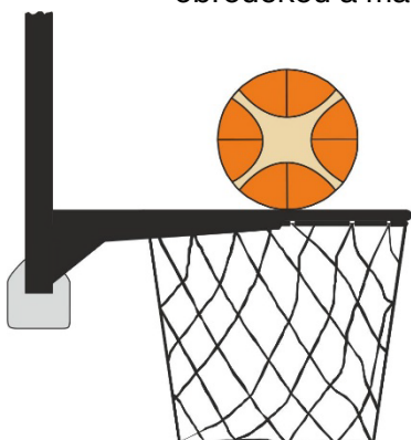
Obrázek 3 Míč je v kontaktu s obroučkou

31 - 19 Ustanovení. Srážení míče nastává, když se během střele na koš z pole obránce nebo útočník dotkne desky nebo koše (obroučky nebo síčky), zatímco je míč v dotyku s obroučkou a má možnost padnout do koše.