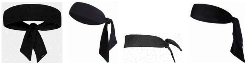
Obrázek 1 Příklady čelenek typu „kravata“

4 - 4 Ustanovení. Nošení čelenky typu „kravata“ není povoleno.